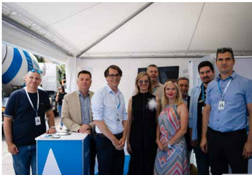
Nekateri predstavniki Alpacem z vodstvom OOO Nova Gorica

Na letošnjem Festivalu obrti in podjetništva v Novi Gorici so se prvič skupaj predstavila podjetja Alpacem Cement , Alpacem Beton in Alpacem Kamnolomi , ki v okviru skupine Alpacem tvorijo celovito verigo gradbenih materialov – od pridobivanja surovin in proizvodnje cementa do izdelave betona.